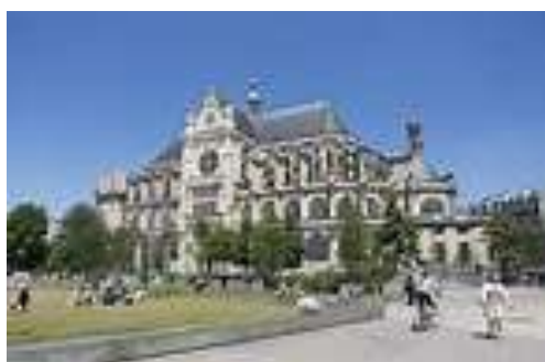
Eglise St Eustache

Contactez-nous : MC Calers 01 39 16 17 86 ou 06 16 04 58 85 A Fruneau : 01 39 58 4710 ou 06 68 67 60 31