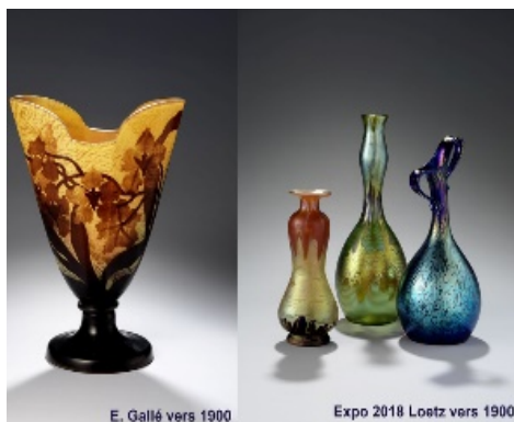
E. Gallé vers 1900

Notre première visite sera pour le Musée du Verre créé en 1996 pour