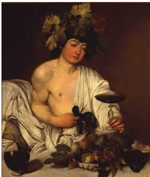
Caravage, Bacchus vers 1693

Peintre graveur français, successeur de Desportes, il a su faire de la peinture animalière un genre à part entière. L'ensemble de son œuvre révèle un grand talent.