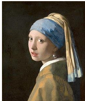
Vermeer - vers 1665 Jeune fille à la perle