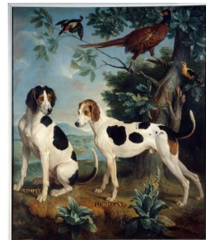
Desportes - 1739 Pompée et Florissant

Contact : Anny David : 01 39 58 17 63 . Inscriptions aux heures d'ouverture du bureau