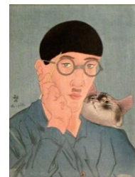
Foujita 1913 auto portrait au chat