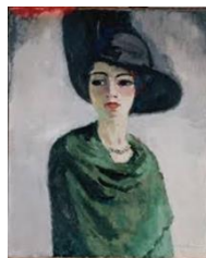
Van Dongen - 1908 la femme au chapeau noir