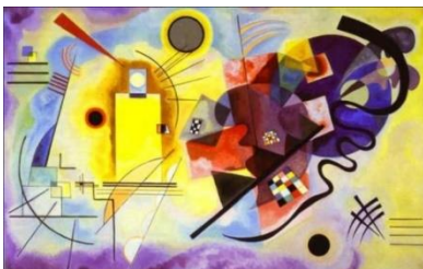
Kandinsky 1925 jaune rouge bleu